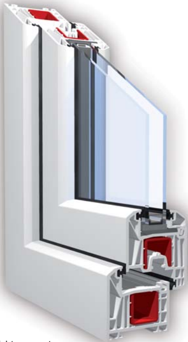
5-Kammer-Anschlagdichtungssystem mit 70mm Bautiefe

Mit ihren gerundeten Konturen und abgeschrägten Kanten bieten Fenster des KBE System_70mm eine zeitgemäße und besonders harmonische Optik. Holzdekor- und Farbvarianten geben Ihnen Freiheit bei der individuellen Gestaltung.